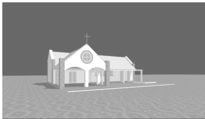
Az új katolikus ravatalozó látványterve