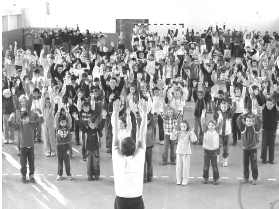
“Szuper néptáncos gimnasztika óra”

bemutatójával kezdődött, közös iskolai tornával folytatódott. Majd előadásokon kellett részt venniük a diákoknak. Itt