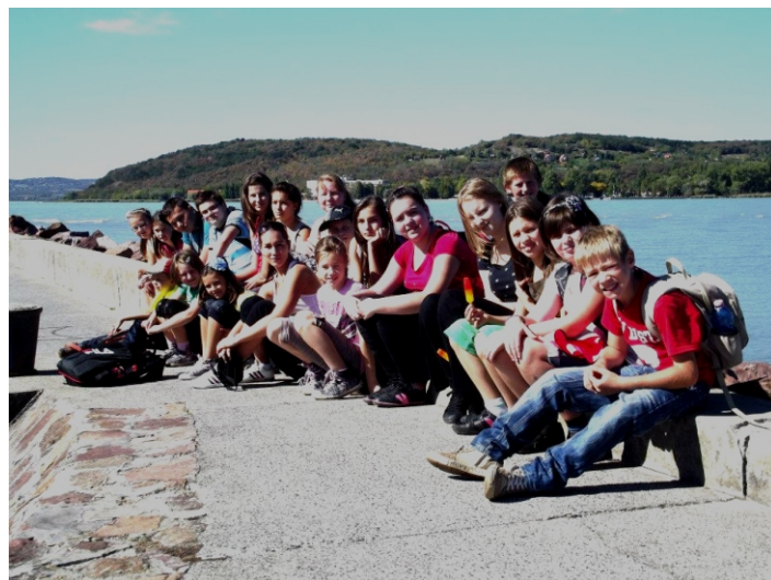
A kirándulók csoportképe