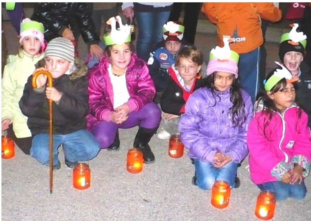
Az 1. a osztályosok műsora a gyógyszertár előtti parkolóban