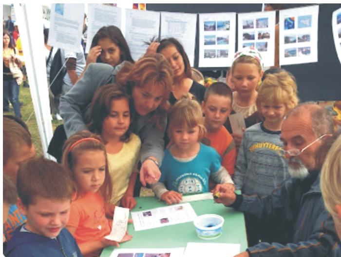
Feladatot old meg az 1. b osztály