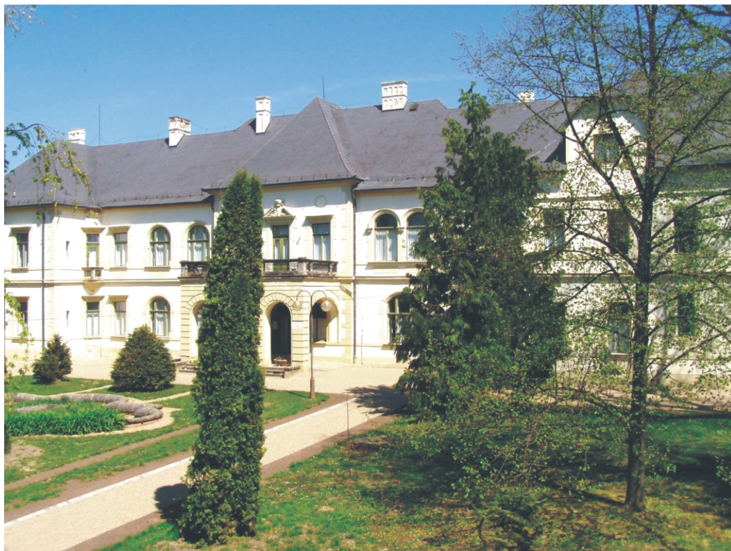
A kastély épülete

Iregszemcsén gyógypedagógiai képzés 1952-ben indult, éppen hatvan éve. Ez alkalomból tartott ünnepi megemlékezést a Göllesz Viktor Tagintézmény szeptember 24-én 10 órától, ahol az iskola tanulói adtak műsort, majd „Segítsünk együtt” Térségi összefogás a sajátos nevelési igényű gyermekek együttnevelése érdekében címmel szakmai konferencián vehettek részt a meghívottak. Az intézmény egykori és jelenlegi dolgozói pedig október 1-én ünnepelhetnek együtt. A következőkben az intézmény eddigi működésének összefoglalóját olvashatják.