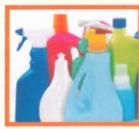
MŰANYAG FLAKONOK: TUSFURDÓS, MOSÓSZERES, ÖBLÍTŐS