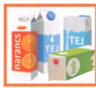
ITALOS KARTONDÖBŐZÖK: TEJES, GYÜMÖLCSLÉS LAPITVA, KIÖBLITVE