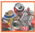
ALUMÍNÍUM ÜDÍTŐITALOS ÉS SÓROS DOBŐZOK

Felhívjuk a figyelmüket, hogy minden hulladék TISZTÁN, SZENNYEZŐDÉSTŐL (étel- és vegyszermaradéktól) MENTESEN helyezhető az edénybe!