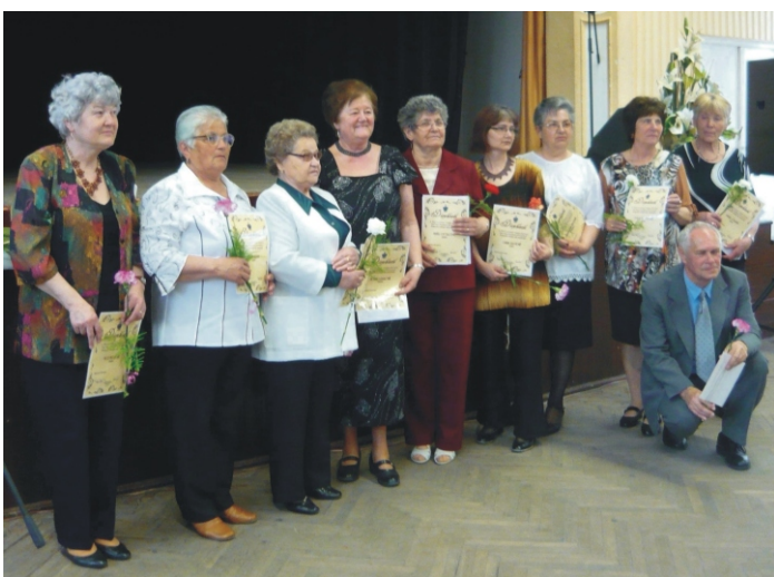
A nyertes versmondók

Az egész napos programot az iredszemcsei „Laguna mazsorett csoport” két remek produkcióval színesítette.