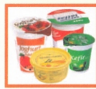
MŰANYAG FLAKONOK: TEJFOLÓS, JOGHURTOS, VIAJÁS