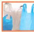
MŰANYAG SZATYOR: EGYSZERHASZNÁLATOS, VOLT HIPERMARKETES