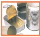
HÁZTARTÁSI FÉM: KONZERVDOBŐZOK, KISEBB FÉM TÁRGYAK