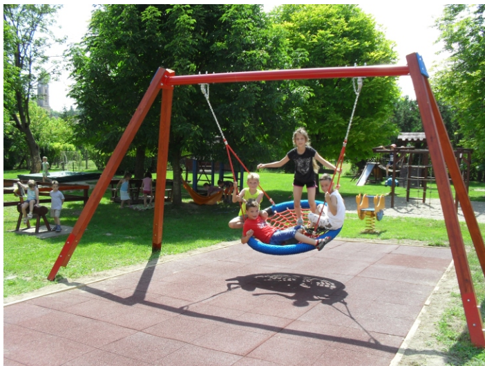
Végre birtokba vehettük!

Köszönettel: az óvoda alkalmazotti közössége