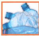
MŰANYAG PALACK: ÁSVÁNYVÍZES, ÜDÍTŐS, BOROS

Kérjük, hogy a szelektív hulladékgyűjtő edényét a megfelelő szállítási napokon reggel 6 óráig sziveskedjen kihelyezni az ingatlan elé úgy, hogy az a közúti forgalmat ne zavarja! A szelektív hulladékgyűjtő gépjármű elhaladása után, késve kihelyezett edényeket nem áll módunkban üríteni.