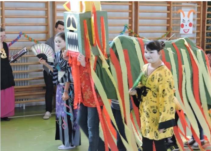
Az 5. b osztály sárkánya a gésákkal