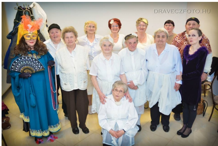
A szervező csapat