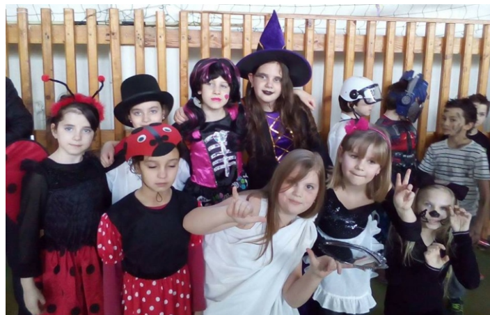
Jelmezben a 2. b osztály