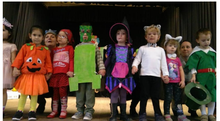
A legkisebbek is jelmezt öltöttek februárban az ovis farsangon, mely az év egyik legizgalmasabb eseménye számukra.