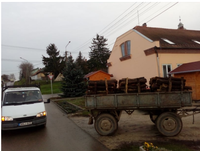
Szociális tűzifával megrakott pótkocsi

Kérem a fent leírtak szíves tudomásul vételét! Köszönöm szépen!