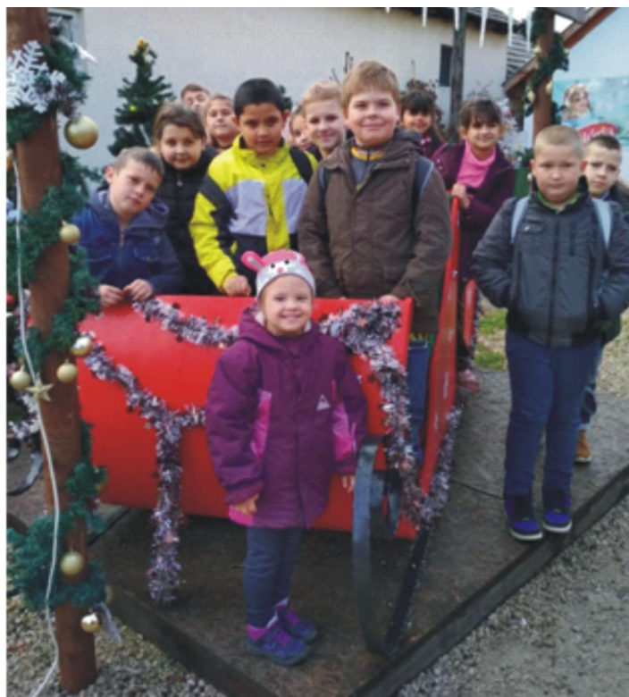
Boldog gyerekek a Mikulás szánjánál