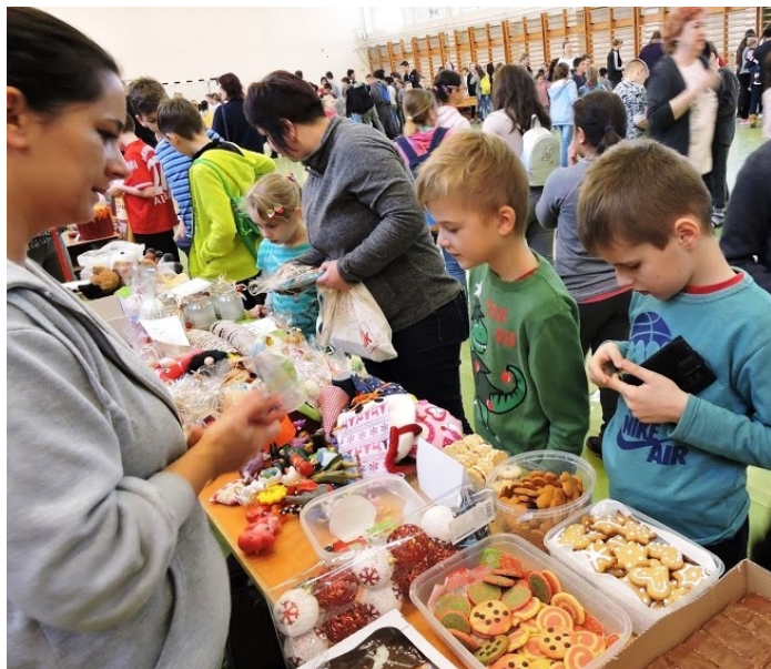
Az adventi vásárban sok portéka talált gazdára

A tornaterem előterében kora délelőtt kezdték sütni azokat a gofrikat, amiknek a finom illata aztán belengte az oktatási intézmény épületét és csalogatta a diákokat, tanáraikat, valamint a gyerekek szüleit a program helyszínére.