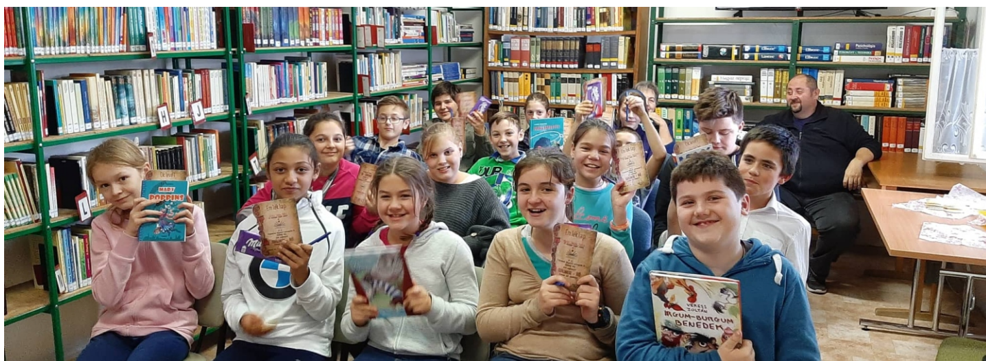
A nyertes meseíró diákok a könyvtárban