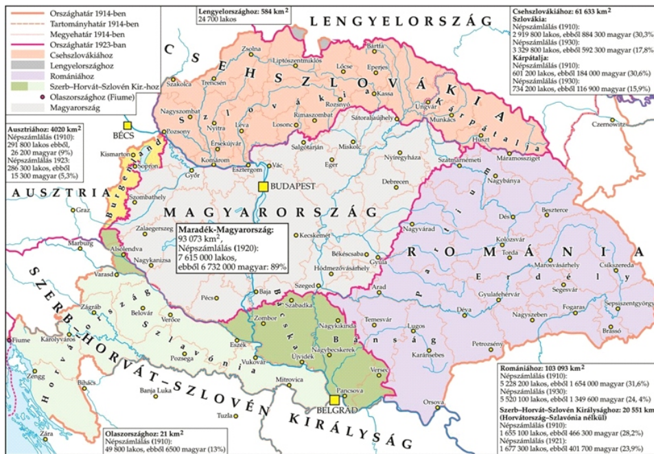
A TRIANONI BÉKESZERZŐDÉS TERÜLETI ÉS DEMOGRÁFIAI KÖVETKEZMÉNYEI 1920, (1924)

Bővebben: Ami 1920. június 4-én Magyarországgal történt, példátlan a történelemben. Az ország 282 ezer km 2 -nyi területéből csak 93 ezer, 20,9 millió lakosából csak 7,6 millió maradt meg. Odaveszett az ország összes arany-, ezüst- és sóbányája, a szénbányák 80%-a, az erdők 90%-a, a vasútvonalak 58%-a és az ezekhez tartozó vasúti szerelvények, a felbecsülhetetlen értékű műkincsek, Fiume, az egyetlen tengeri kikötő, az összes tengeri és folyami hajó, a kiépített utak 64%-a. A korábbi évekhez képest az ország ipara 48%-ra, a foglalkoztatottak