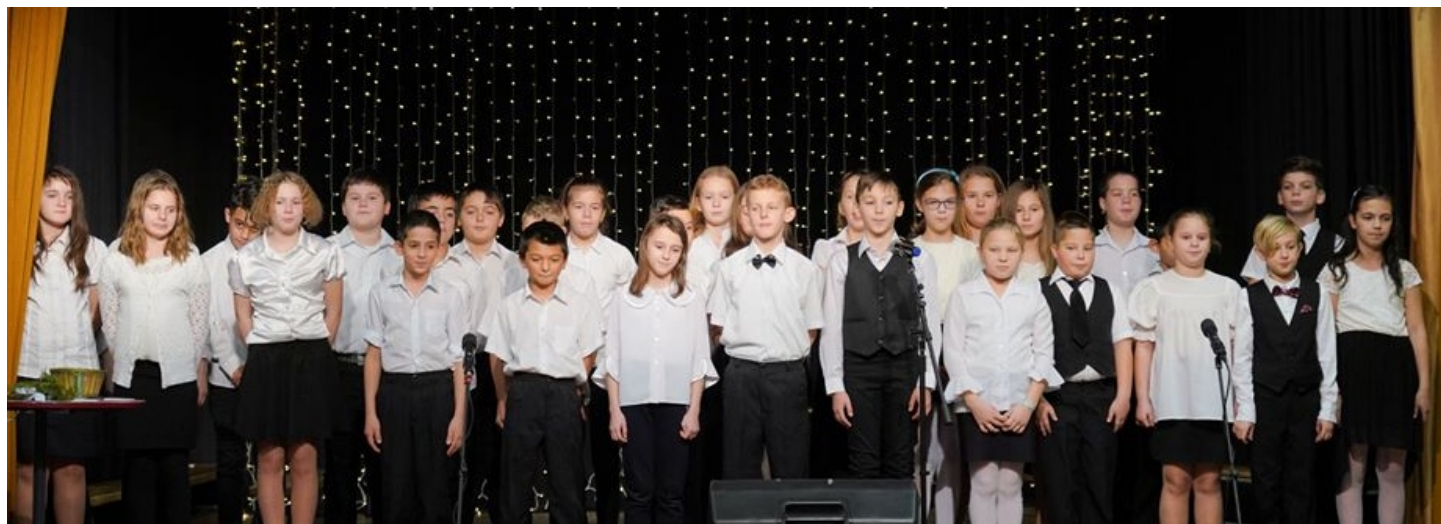
A negyedik évfolyam a karácsonyi műsoron