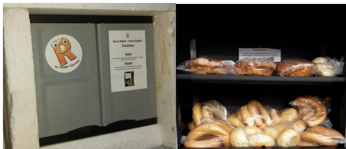
Az ételdobozt folyamatosan töltik

Az Enni adok ételdoboz egy 65x59x39 cm-es szekrény, amely műanyagból készült fém megerősítésekkel. A szekrény vízálló és UV védett anyagból készült. A dobozhoz tartozik egy önkéntes csapat. A csapat naponta legalább egyszer, melegebb időjárás esetén naponta többször is látogatja a dobozt, ellenőrzi a benne lévő élelmiszereket, ételeket. Az önkéntesek naponta takarítják is a dobozt. Mit lehet tenni a dobozba? Bármilyen tartós élelmiszert (liszt, cukor, só, tészta, rizs, olaj, konzervek, befőttek, lekvárok stb.), házi készítésű főtt ételt és házi süteményt, bolti süteményeket és készételeket, zöldségeket, gyümölcsöket, édességet, pékárut, minden emberi fogyasztásra alkalmas élelmiszert!