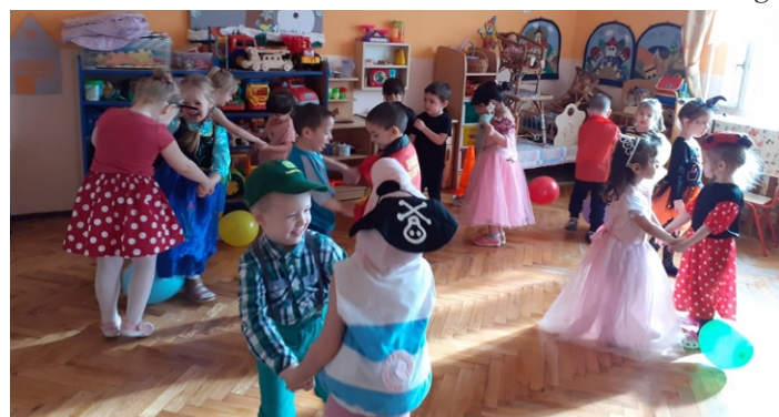
Farsangi mulatság a Nefelejcs Óvodában